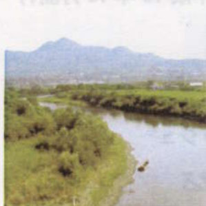
雄大な名久井岳と馬淵川の流れ