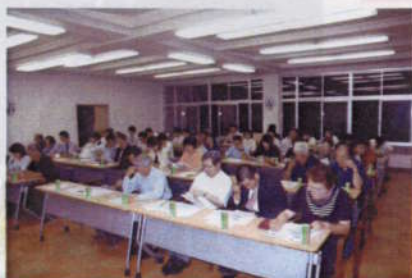
達者村づくり委員会を組織 (6月)