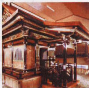
国重文「南部利康霊屋」