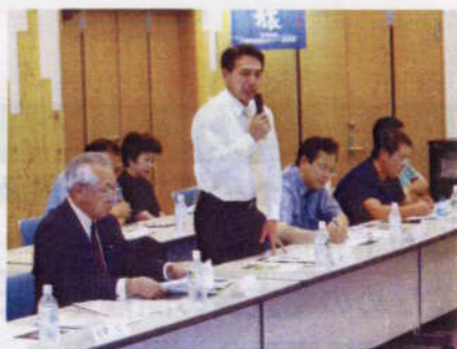
深浦町で初のあおもりツーリズム交流会 (7月)