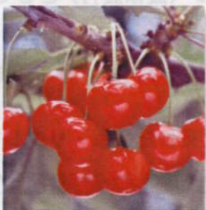
特産果樹「さくらんぼ」