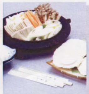
郷土料理「せんべい汁」