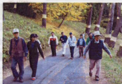
健康メニューを取り混ぜ実施した「達者で生き生き健康ツアー」 (11月)

「達者村」は、地元住民の積極的参加、そして関係機関等の協力のもと着実に成長を遂げています