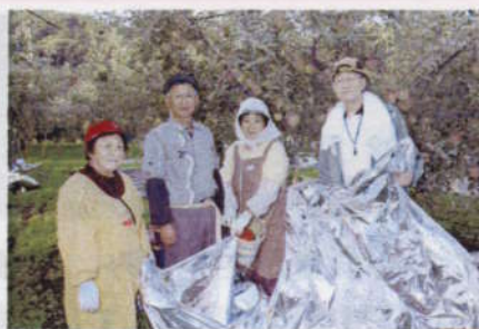
セカンドライフの「暮らし」と「しごと」大学 in 達者村を開催 (7月・9月)